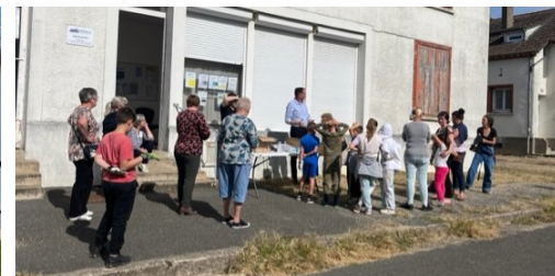
Photo - Quartier propre La-Guerche-sur-l'Aubois - Val de Berry