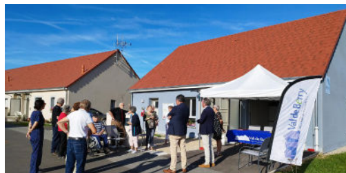
Photo - Signature charte - Val de Berry