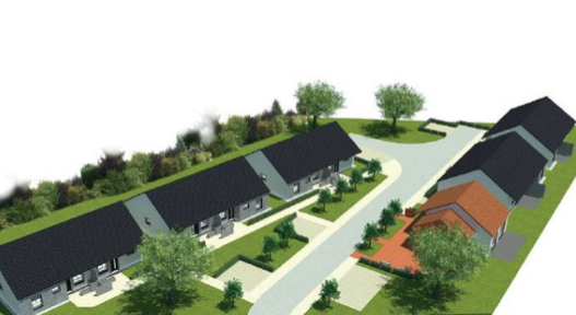
Vue 3D de la résidence seniors domotisée - Val de Berry