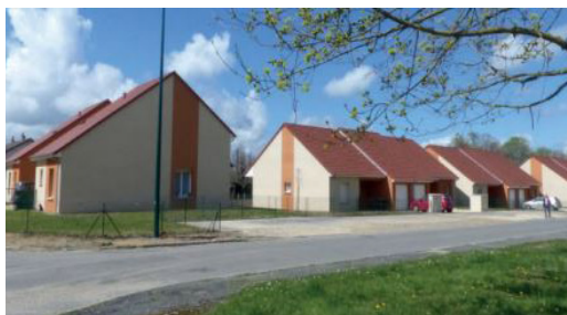
Photo - Pavillons - Val de Berry