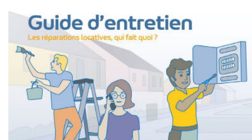
Guide d'entretien - Val de Berry