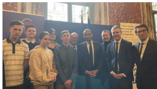
Jeunes reçus au Ministère de la Justice - Val de Berry