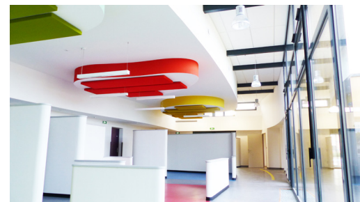
Centre de Santé - Vierzon - OPH du Cher

Pour payer votre loyer, différentes solutions s'offrent à vous : chèque, virement, carte bancaire (dans nos agences), en numéraire (à La Banque Postale), TIP et prélèvement automatique. Pratique : optez pour le prélèvement ! 3 dates sont au choix (5, 10 ou 15 de chaque mois). Pour plus d'informations, rendez-vous sur notre site web www.oph18.fr ou dans l'une de nos agences.