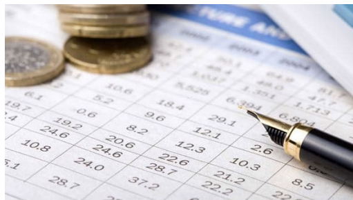
Illustration - Calcul du loyer - Bureau24.fr

La fusion entre l'Office Public de l'Habitat du Cher et Bourges Habitat peut entraîner quelques changements mineurs pour vous. En premier lieu, vos interlocuteurs. Vous retrouverez dans notre dossier (au dos de cette même page) les numéros de téléphone, adresses e-mail et postales de nos agences. En cas de besoin, cela pourrait vous être très utile pour contacter nos services !